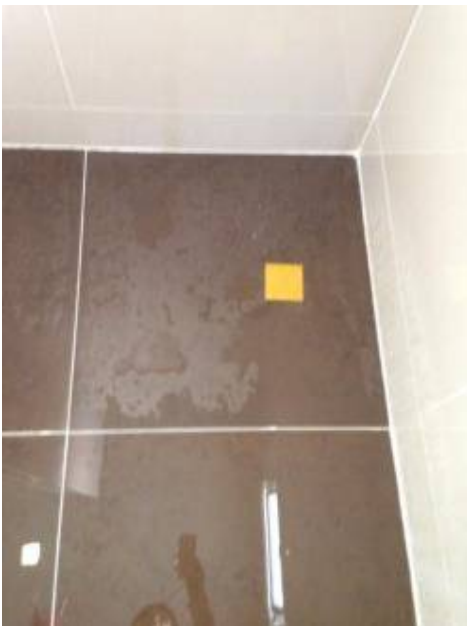
3. กระเบื้องโพรงตรงห้องอาบน้ำ