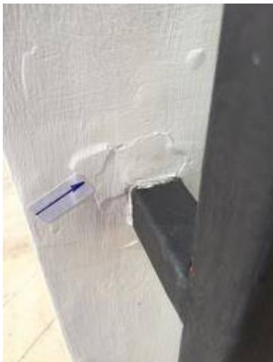
8.เก็บสัรอยต่อรั้วเหล็กซีคทั้งหมด