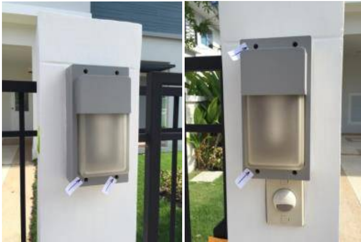
1. เปลี่ยนน็อตตึงไฟเพราะขันสนิมสองดวงหน้าบ้าน