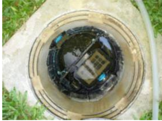
ติดตั้งถังบำบัดใหม่