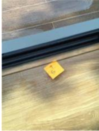
2. เก็บงานซิลิโคนตรงรอยจบลามิเนตใหม่. + พื้นลามิเนตยวบตรงประตูบาน เลื่อน