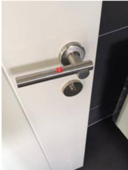
1.มือจับเป็นคราบ ทำความสะอาด