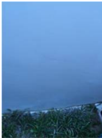
2. ผนังเป็นคลื่น สีพอง. ทาสีใหม่(ทั้งหมดรอบๆบ้าน)