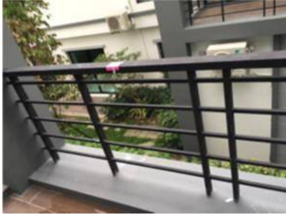
6. ทาสีราวกับตึกใหม่+ทาสีกันสนิม. ทาสีใหม่ทั้งหมด