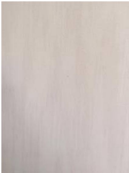
2. วอลเปเปอร์เปิด