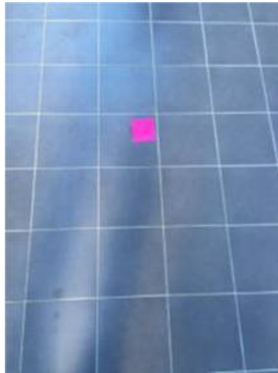
3.ยาแนวพื้นบางจุด