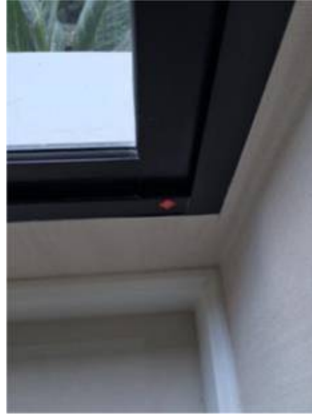
4.เก็บสีตามขอบดาวไลท์