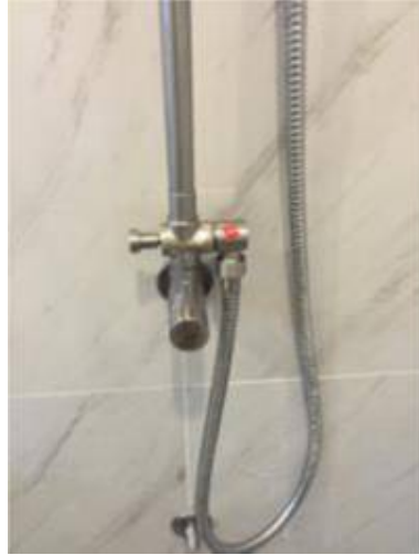
2.สายฝักบัวรั่ว