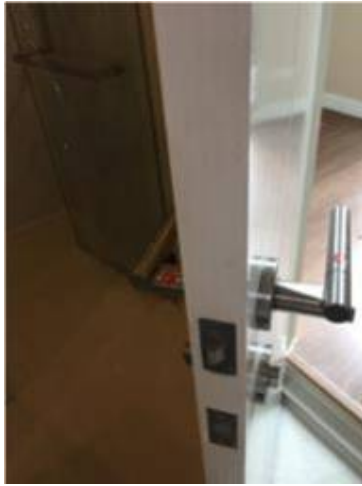
1. มือจับเป็นคราบ