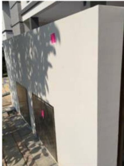
3.เก็บสีใหม่กำแพง