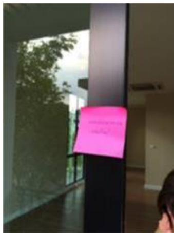
5.กระจกบานเลื่อนเป็นรอย+เก็บงานซิติโคนตามขอบเฟรมตามรอบ