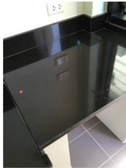
2.เก็บงานซิงค์ตรงเคาน์เตอร์