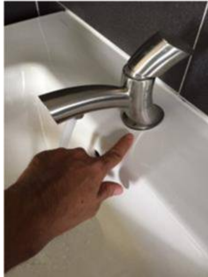
2. ก๊อกน้ำขึ้นสนิม