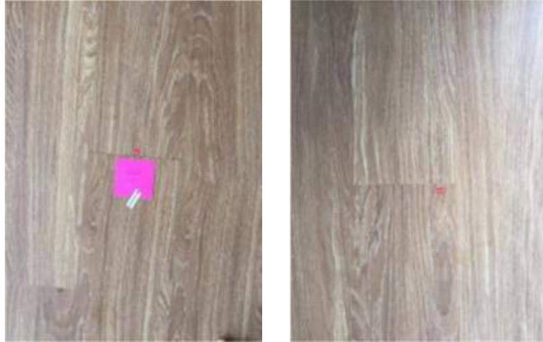
3.พื้นลามิเนตยวบวม3แผ่นลามิเนตไม่ชิดแก้ไขใหม่