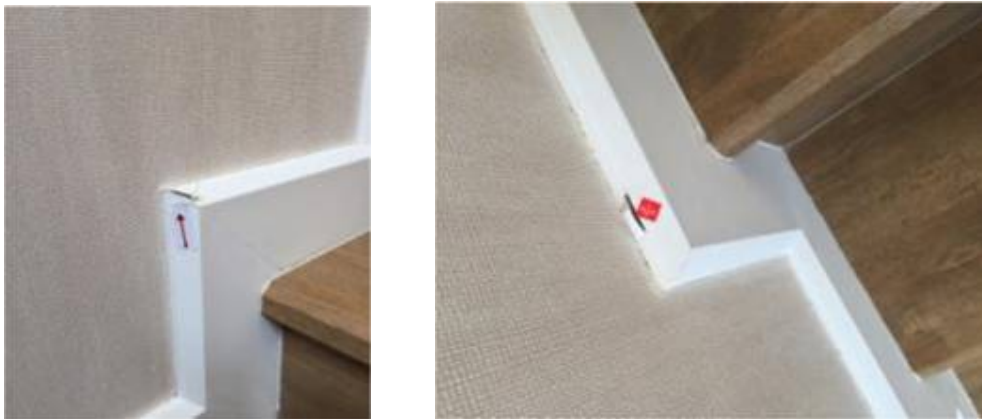
2. เก็บงานบัวตรงบันได