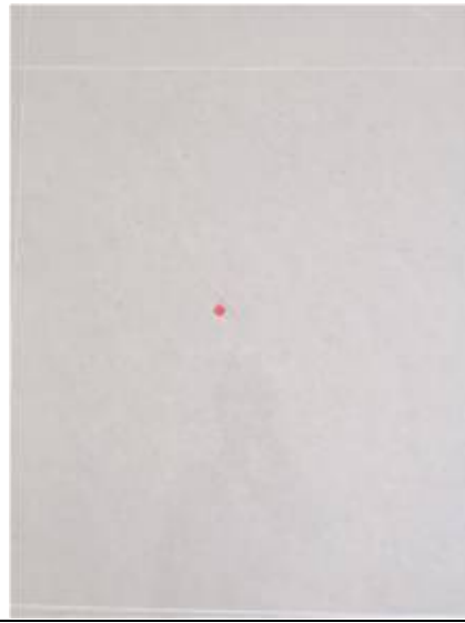
1. กระจกเป็นรอย 5 แผ่น