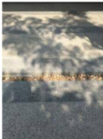
4.เก็บสีหยดตรงทรายราง