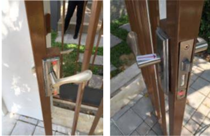
2.มือจับเป็นคราบ (เปลี่ยนใหม่) + ติดตั้งใหม่+เปลี่ยนน็อตขึ้นสนิม