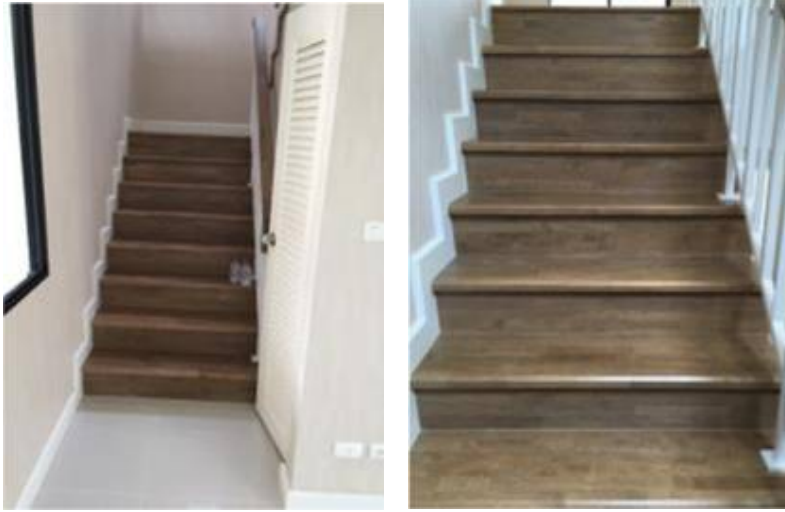
1. เก็บงานไม้บันได