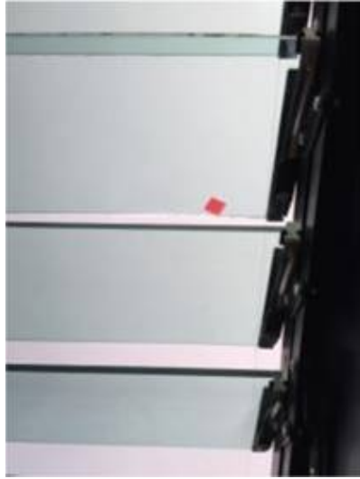
3. เปลี่ยนกระจกบานเกร็ดใหม่