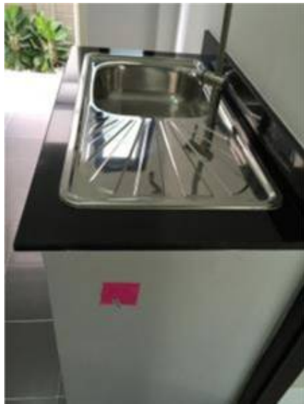
1.ทำความสะอาดผนังซิงค์ + เก็บสี