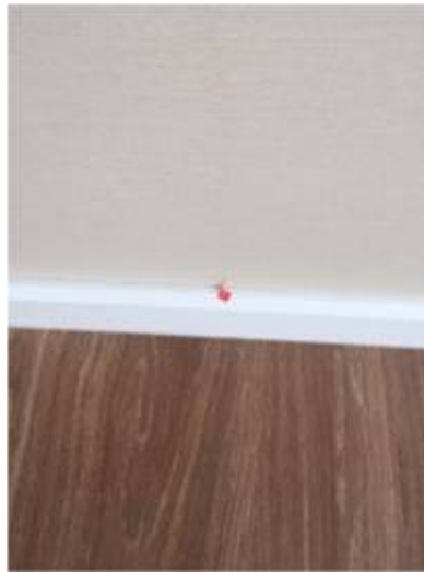
4.เก็บงานวอลเปเปอร์เปิด