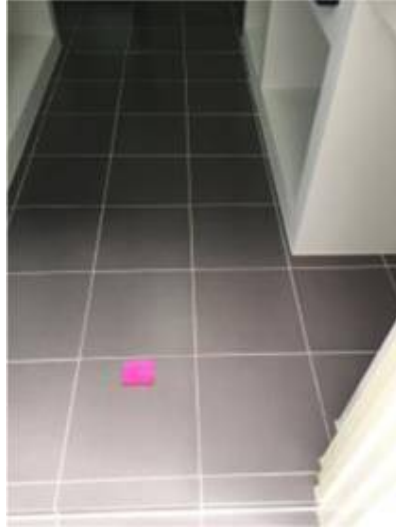
4. ขาแนวพื้นกระเบื้องบางจุด