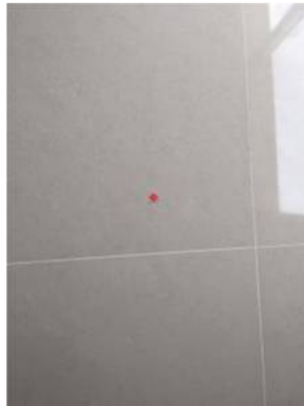
3. ยานแนวพื้นใหม่