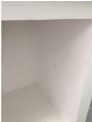
6. เก็บงานตามขอบเฟรมโดยรอบ