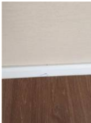
3. เก็บรอยต่อบัว