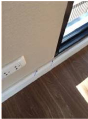
2. เก็บงานบัวโดยรอบทั้งหมด+เก็บงานรอยต่อบัว